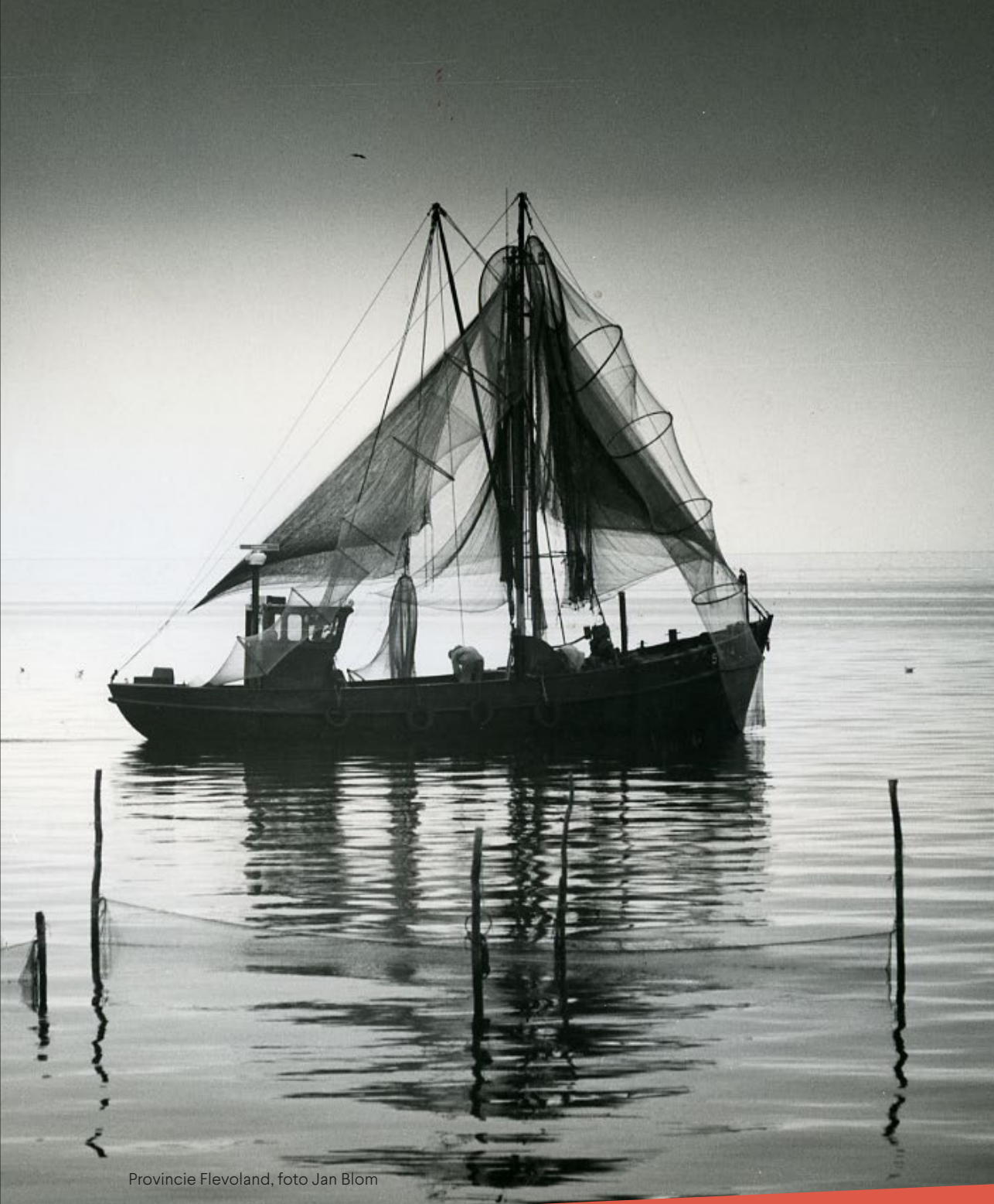
Provincie Flevoland